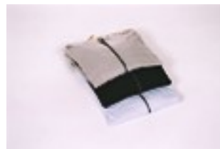
Sweater met rits & kap à 39 €

*Wij hebben ook bio zachte handdoeken, ondergoed van bio-katoen en bamboe, bio-katoenen en wollen sokken..