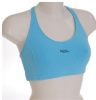
Sportbeha à 17,50 € (ook in zwart)