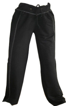
YOGABROEK à 35 €

*Ook de bamboe basics , relax- en sport kledij komt op regelmatige tijdstippen terug binnen, vind je jouw maat niet meer, bestellen wij dit graag voor jou! De bamboe t-shirt zijn ook lekker warm en zacht voor de komende winterdagen en tevens milieuvriendelijk!