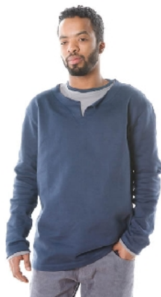
Sweater blauwgrijs 49€