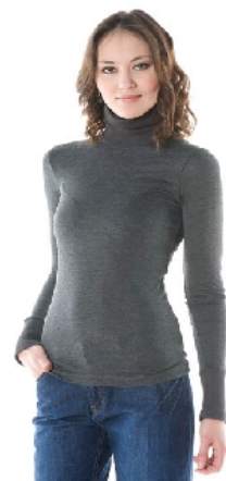
Tuniektrui grijs 49€