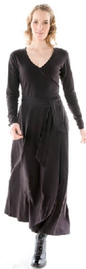
Wikkelkleedje lang zwart 69€