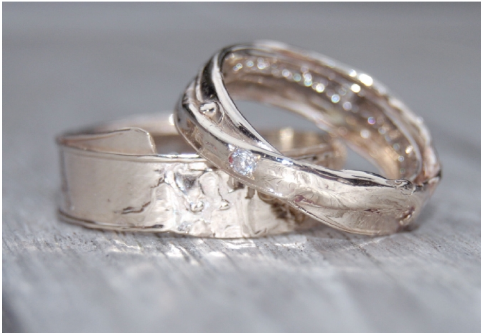
Ontwerp door Sandra Delellio

De Workshops gaan het hele jaar door op afspraak. Aarzel niet om hiervoor met ons contact op te nemen!